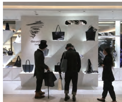
discord 銀座6

2002 ミラノサローネ“TEA TABLE COLLECTION”「Tea Table in Vermilion」 出展(MILANO - MUSEO MINGUZZI)