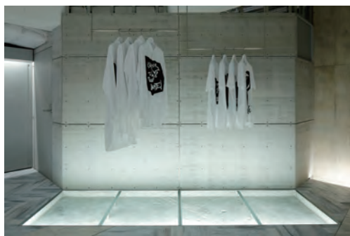
Y's 表参道ヒルズ ©Kozo Takayama