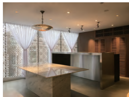
Lalla Fatima 神宮前