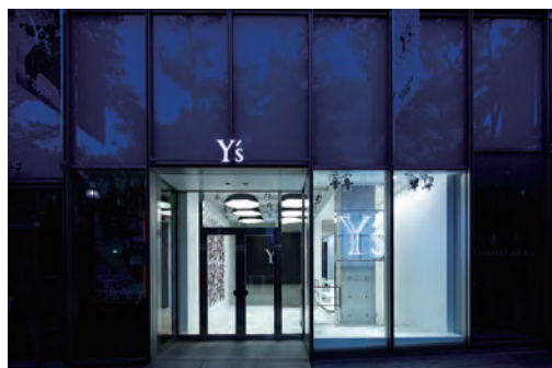
Y's 表参道ヒルズ ©Kozo Takayama