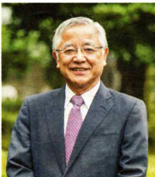
【プロフィール】広島県生まれ。1976年広島大学医学部卒業後、聖路加国際病院内科勤務。99年東京医科大学循環器内科主任教授。2020年5月から現職。総合内科専門医、日本循環器学会専門医、前日本循環器病予防学会理事長。