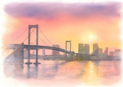
「夕日のレインボーブリッジ」

著書に「絵がうまくなる 色鉛筆のすごい！ぬり絵」（青春出版社）、 「12色からはじめる 水彩画混色の基本」（大泉書店）、 「野村重存による絵を描くための風景の写真集」（マール社）、 「見るだけで上達!! 野村重存3色で描く水彩画の手ほどき」（日貿出版社）など多数。